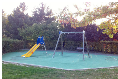
L'aire de jeux du futur ? Sol défoncé et aucune corde à la balançoire depuis des années... Avenue de l'Iroise