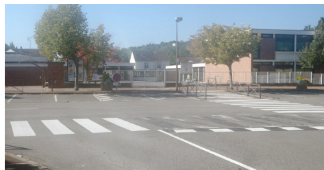
Le "saute-piéton", où comment les travaux à Maurepas sont bien réalisés. Délirant ! Ecole de la Marnière - Rue de Penthièvre