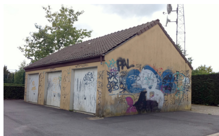
Un nouvel art urbain soutenu par la municipalité ? Avenue de l'Iroise